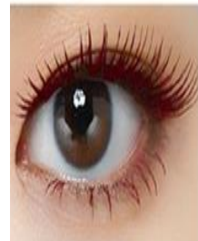
신비로운 플럼 버건디 #3