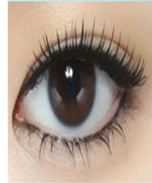
#1 또렷한 블랙