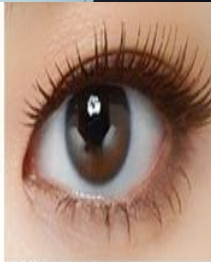
#2 청순한 브라운