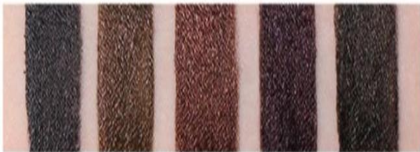
#1 Black #2 Brown #3 Pearl Brown #4 Plum Wine #5 Olive Black